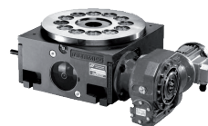
Tavole rotanti meccaniche