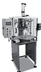
Tavole Pressa kN 5 ÷ 320