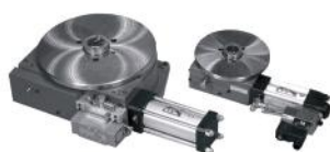
Tavole rotanti pneumatiche