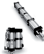
Unità idropneumatiche Unità di potenza kN 20 ÷ 320