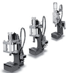
Presse pneumatiche kN 1 ÷ 20